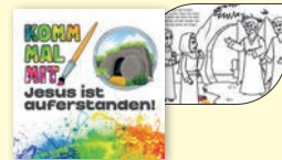
KT240 Komm mal mit

Mit der Doppelkarte versenden Sie Ostergrüße für ein Leben mit Perspektive über den Tod hinaus.