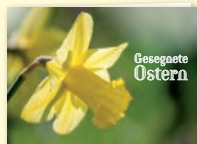
K0609 Gesegnete Ostern

Wollen Sie auch Lebensfreude wecken? Marburger Medien unterstützen Sie dabei gerne!