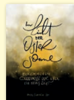
PK377 Im Licht der Ostersonne

Für einen spielerischen Zugang zum Ostergeschehen: Ist die Beschichtung weggerubbelt, kommt eine Botschaft zum Vorschein, die der Text auf der Rückseite noch vertieft.